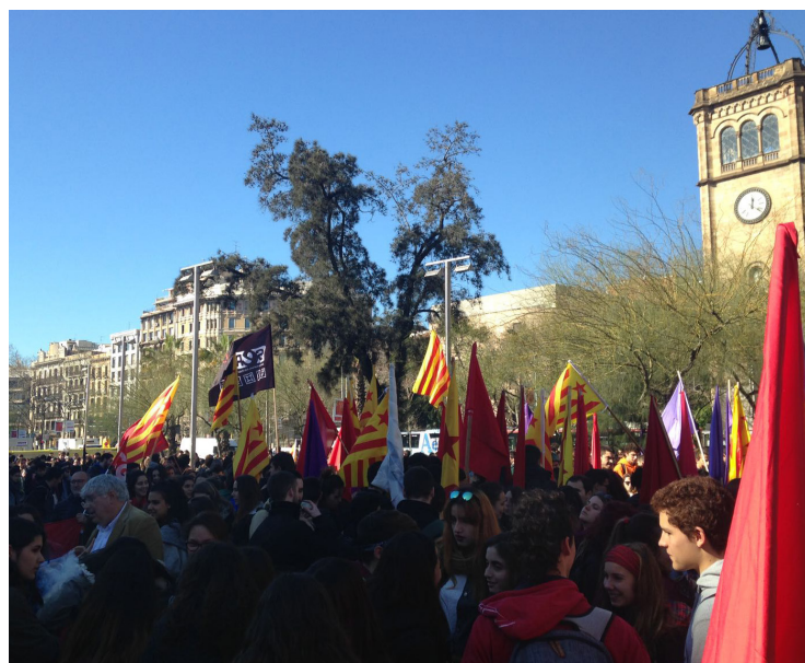
Manifestants ahir a la plaça Universitat de Barcelona. LAIA RECASENS

Les crítiques que es fan a la llei des del SEPC són diverses. Segons el sindicat, la LOMQE treu poder dels Consells Escolars i això repercuteix en la "pèrdua de democràcia interna". També es critica l'intent de "recentralització curricular", l'eliminació de l'assignatura Educació per la Ciutadania i la introducció de la religió amb ca-